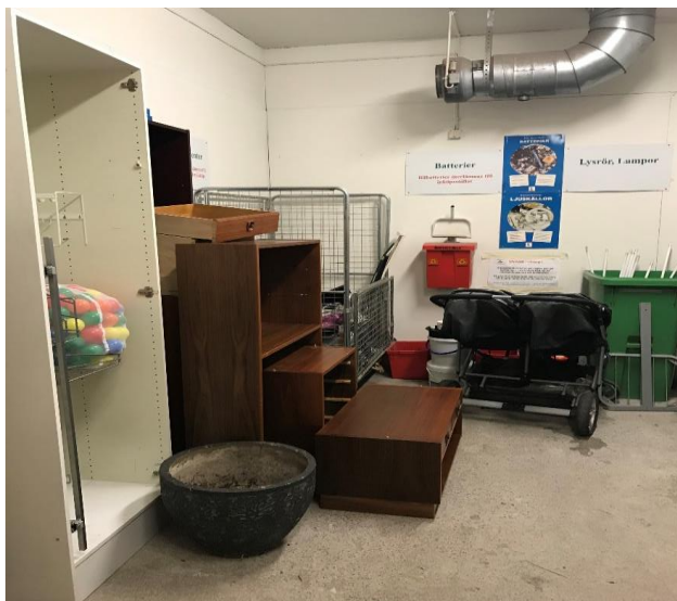
Bosse Lundström – säkerhet och trafik